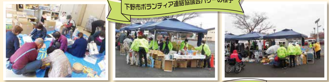
下野市ボランティア連絡協議会バザーの様子

11月26日～12月5日まで、3年ぶりにしもつけふくしフェスタを開催しました。ボランティア連絡協議会では、規模を縮小してバザーを行いました。当日は雨の降る中での開催でしたが、多くの方が訪れ盛況でした。また、ゆうゆう館のホールでは、ボランティアセンターに登録している団体の手作りポスター・写真・パンフレット、作品などを展示し、活動のPRを行いました。今年は活動を再開した団体も多くなり、地域での活躍が期待できる内容の展示となりました。