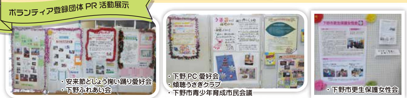
ボランティア登録団体PR活動展示