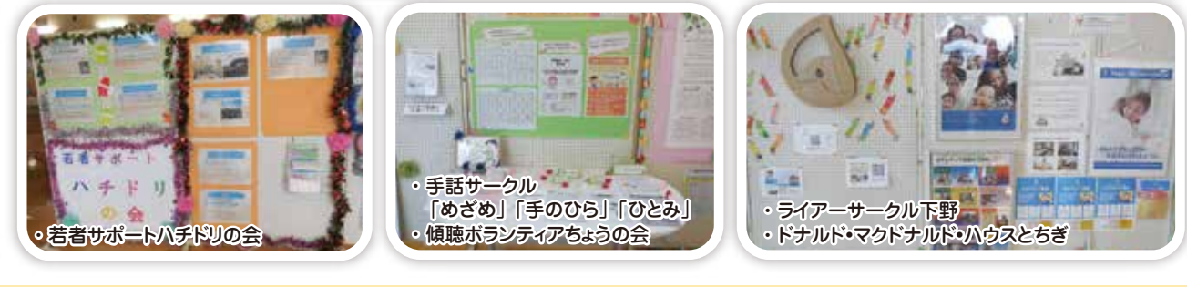
若者サポートハチドリ会