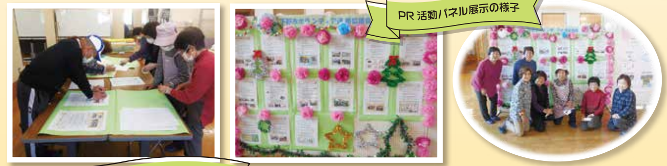
PR活動パネル展示の様子