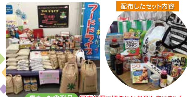
配布したセット内容

集まった食料品を12月4日に一斉配布いたしました。朝早くから多くの方にお集まりいただき、ご用意した74セットは全て配布いたしました。次回は、令和5年6月頃実施予定です。詳細が決まりましたら、社協だよりでお知らせいたします。