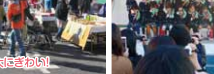
心に響く、すばらしい演奏♪