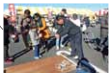
寸劇で振込めサキの注意よびかけ