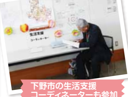
下野市の生活支援コーディネーターも参加