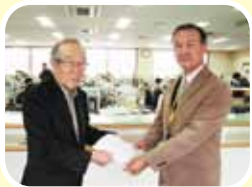
第11回市民農園まつり 実行委員会