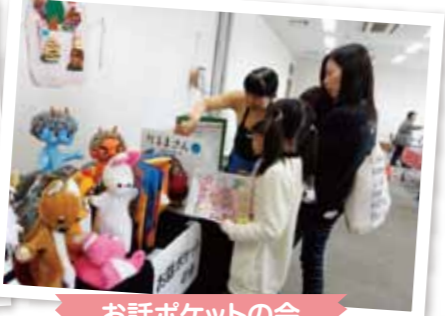
お話ポケットの会