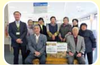
南河内地区老人クラブ女性部