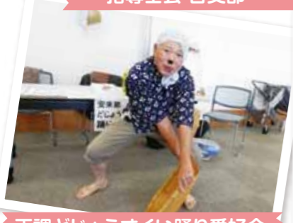
正調どじょうすくい踊り愛好会