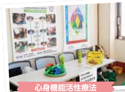
心身機能活性療法指導士会 杏支部

12月3日に行われたふくしフェスタにおいて、今年は地域のためにボランティア活動を行っている団体の紹介ブースを設けました。各団体で手作りのポスターや掲示物を用意し、前日の準備を含め自らPRに携わっていただきました。それぞれ工夫を凝らして企画していただき、とても賑やかなコーナーとなりました。また、ボランティア連絡協議会15団体の活動内容も掲示し、来場したお客さんも熱心に説明を聞いておられました。